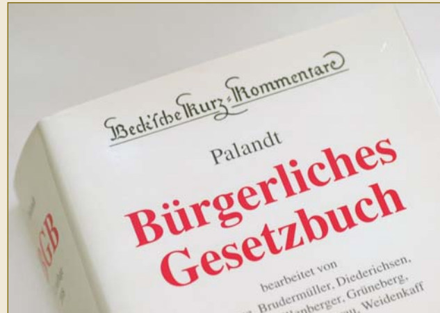
Commentary on the Civil Code: the entire court rulings at a glance.

German law is both predictable and reliable. The legislator sets the systemic and structural parameters, while lawyers and civil law notaries use the law to shape and organise specific situations.