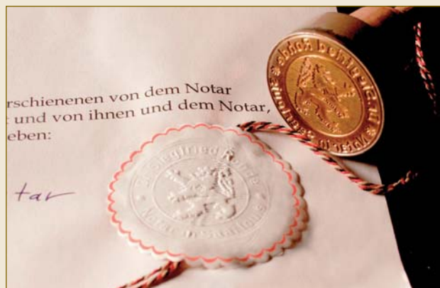
Die notarielle Urkunde: Damit kommen Sie schneller zum Ziel. The notarial deed: the fast track to your goal.

Ein Wettbewerber berichtet über angebliche Zahlungsschwierigkeiten der NRR MedTech GmbH.