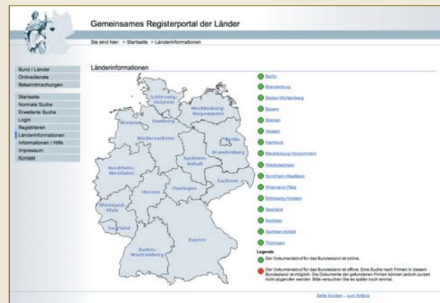
Für jedermann online zugänglich: das deutsche Handelsregister ( www.handelsregister.de ).

In Rechtsordnungen ohne zuverlässige Register muss die Vertretungsbefugnis von Gesellschaften regelmäßig von Anwälten überprüft und in so genannten Legal Opinions bescheinigt werden. Dies kann in den USA schnell bis zu fünfstelligen Dollarbeträgen kosten.