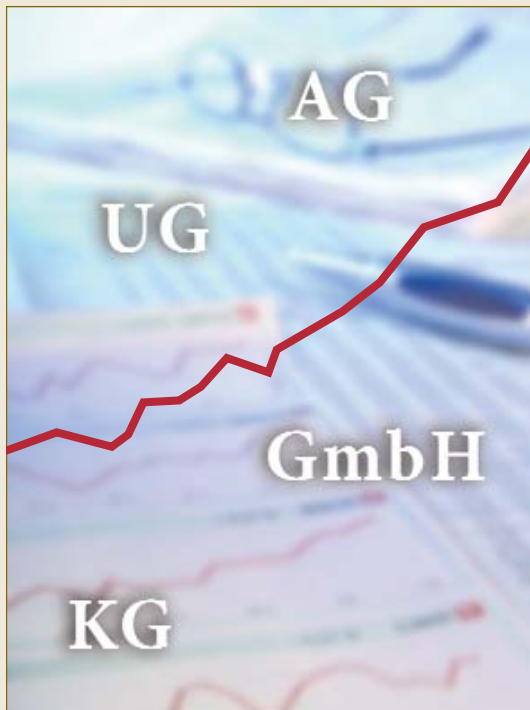
Deutsches Gesellschaftsrecht – international eine Erfolgsgeschichte. German company law – an international success story.

Das deutsche Handelsgesetzbuch regelt die Personenhandels-gesellschaften, von denen die Kommanditgesellschaft (KG) im Wirtschaftsverkehr am häufigsten anzutreffen ist. Insbesondere kleine und mittlere Unternehmen greifen auf diese Rechtsform zurück. Jede Kommanditgesellschaft besteht aus mindestens einem unbeschränkt haftenden Gesellschafter, der auch eine Kapitalgesellschaft sein kann, und einem oder mehreren Kommanditisten, deren Haftung auf ihre jeweilige Einlage beschränkt ist.