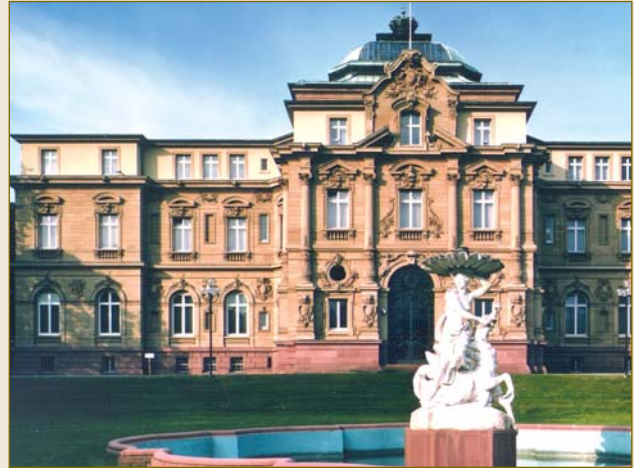
Der Bundesgerichtshof, das oberste deutsche Gericht in Zivilsachen.

Zur Berechenbarkeit deutscher Zivilprozesse trägt auch das deutsche Haftungsrecht bei. Extrem hohe Schadensersatzsummen, wie beispielsweise in den USA üblich, gibt es in Deutschland nicht. Auch der Gedanke eines „Strafschadens“ ist dem deutschen Recht, das lediglich den tatsächlich entstandenen Schaden ausgleicht, fremd. Als Unternehmen ist für Sie ein etwaiges Prozessrisiko daher sehr gut kalkulierbar .