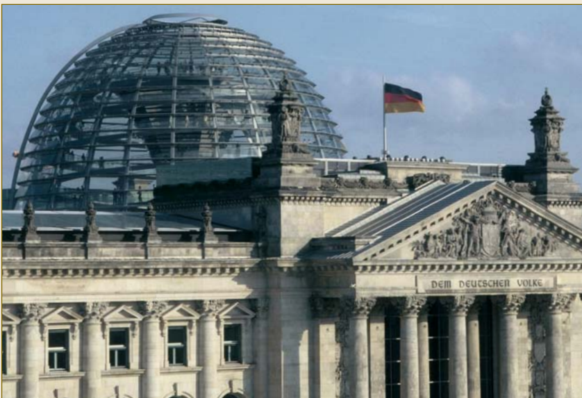
Law – Made in Germany: Der Deutsche Bundestag.

Als Unternehmer benötigen Sie gut ausgebildete Arbeitnehmer, eine leistungsstarke öffentliche Verwaltung, ein funktionierendes Bildungswesen, Straßen, Bahnhöfe und Flughäfen, vor allem aber auch eine funktionierende und berechenbare rechtliche Infrastruktur. Alle diese Rahmenbedingungen bietet Ihnen Deutschland in optimaler Weise.