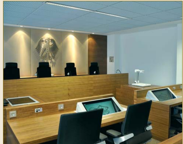
Bundespatentgericht in München.

Disputes in courts not only centre around legal questions but, first and foremost, around questions of fact .