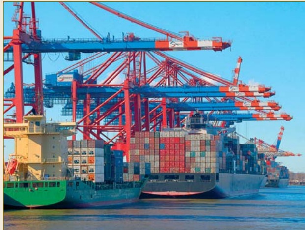
Gerade im internationalen Handel ist ein verlässliches Rechtssystem unerlässlich. A reliable legal system is indispensable, particularly for international trade.

Sicherungseigentum und Eigentumsvorbehalt sichern den Kreditgeber, obwohl er nicht oder nicht mehr im Besitz der Sache ist. Hier zeigt sich das deutsche Recht erheblich flexibler und effizienter als andere Rechtsordnungen, die Sicherungsrechte immer vom Besitz der Sache abhängig machen.