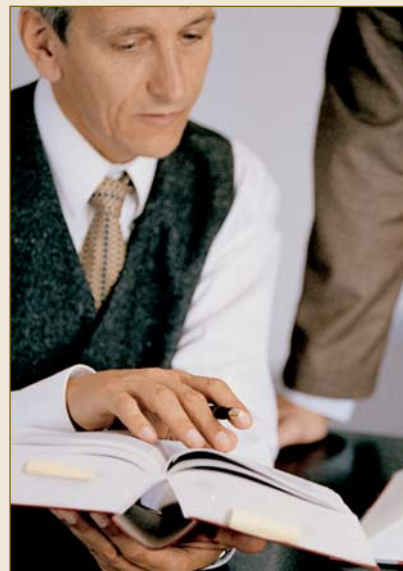
German lawyers: experts in drafting contracts.

The contract of manufacture , which is regulated in great detail in the Civil Code , provides clear rules for the contract drafter, taking into account the interests of both parties. These rules span the entire contractual process, from order placement through to